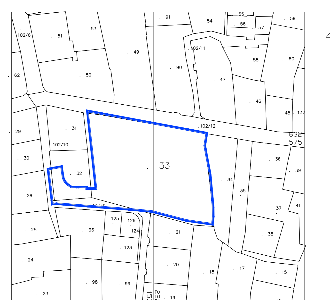
תרשים סביבה קיים 1:250

תורת : 1. הפנידו ינונת השורות כנונדות ארצית 2297/4154 2. רב'כום משורים כנסודה 6.P.S.2297 שנובה 762.14 נונה מידה 1:250 0 5 10 20 25 30 מטר 4 3 2 1