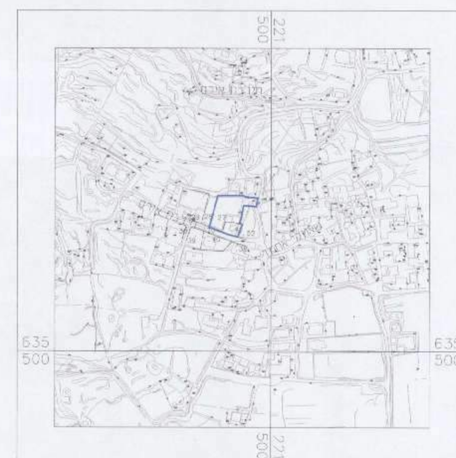
תרשים התמצאות כללית 1:5000