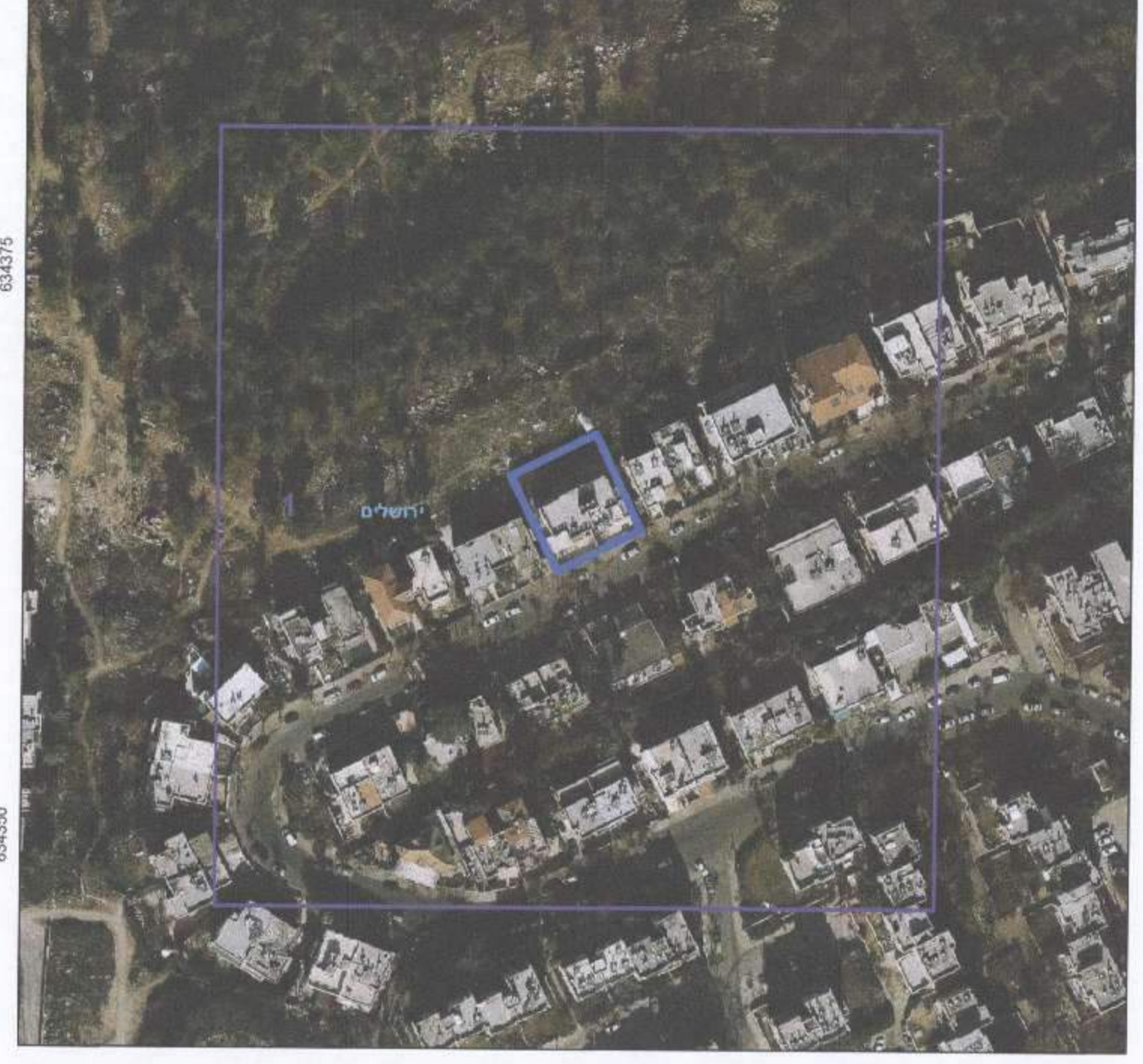
תרשים סביבה - קנ"מ 1:1500