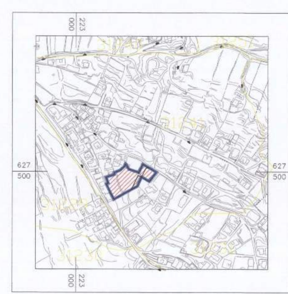
תרשים סביבה ק"מ 15000