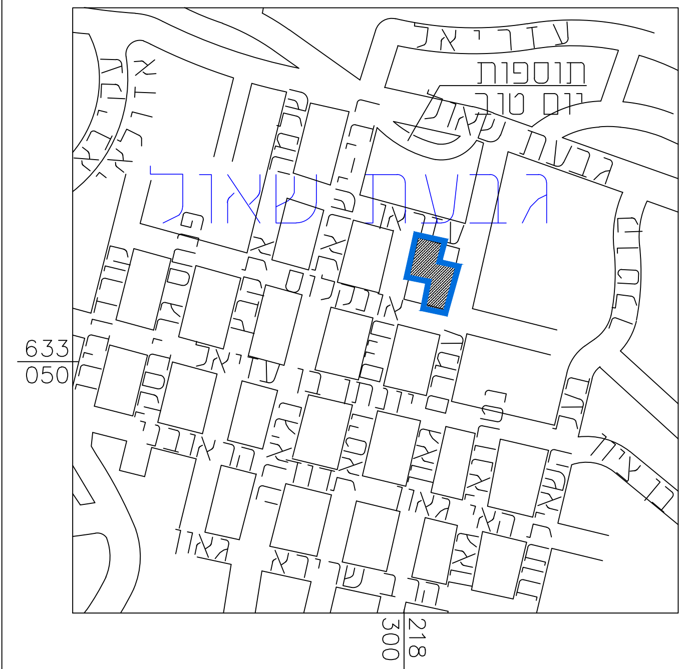
תרשים התמצאות כללית קנ"מ 1:5,000