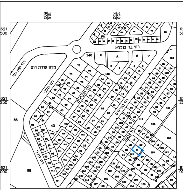
תרשים סביבה קנ"מ: 1:5000

מספר התוכנית 9414-1 רמת דיוק הפז הבסיס והקוטסטר 1 = מדידה גרפית 2 = טו כחול נכלבד ברמה אנליטית 3 = מדידה אנליטית מלאה ברמת תצד 1. המדידה המסודרת ר"ני מוגדר בזאת כי מדידת תפפה המפומטרפית/ המבצבת המוחה רשם לתוכנית זו. נעלה על ידי: 7.12.2014 ביום וזרא וזכנה לפי רוראות נוהל מבאית ובתואם לרוראות החוק ולתקנות המודדים שבתוקף. שם המודד: אגשיאן מספר רישוף: 477 תחיתם: חר"ר