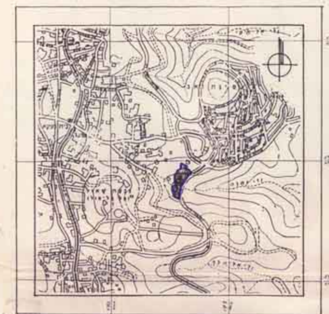
תרשים הטביבה ק.מ. 1:15000