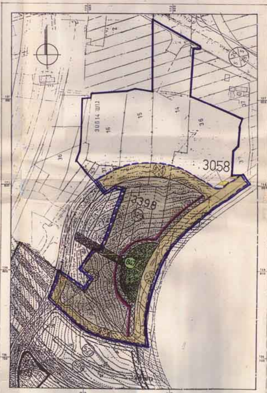
מבט מאושר עפ"י תכניות מס' 3398, 3058 ק.מ. 1:1250

תוכן המסמך אינו מהווה תעודת רישום (המדינת ישראל) תת"מ 1000