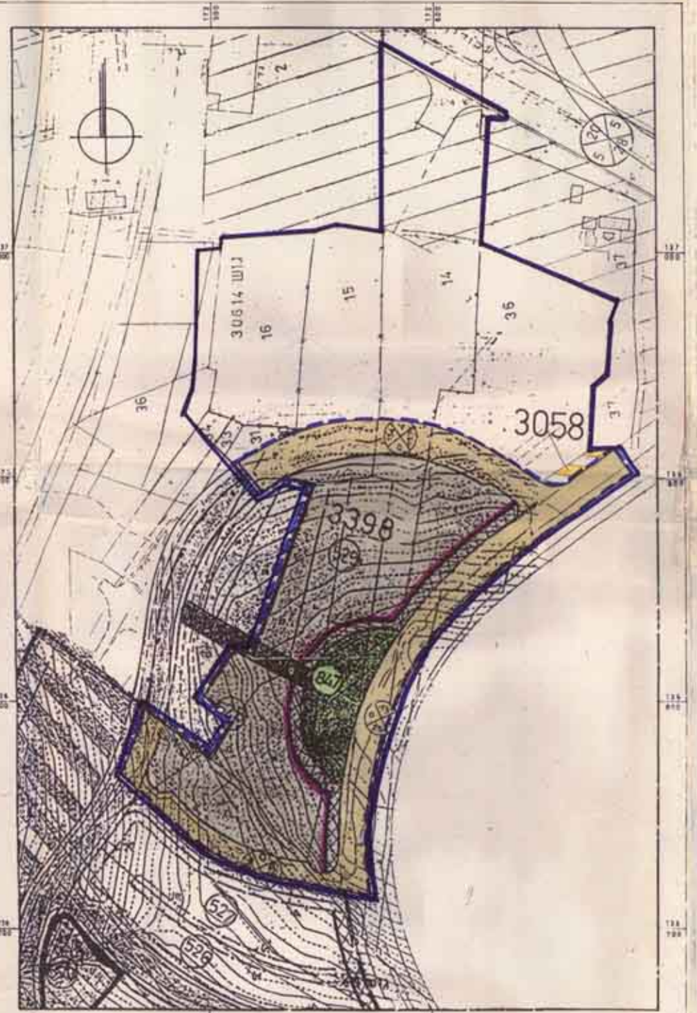
מבצ. מאושר עפ"י תכנית מס' 3398, 3058 ק.ת. 1:1250