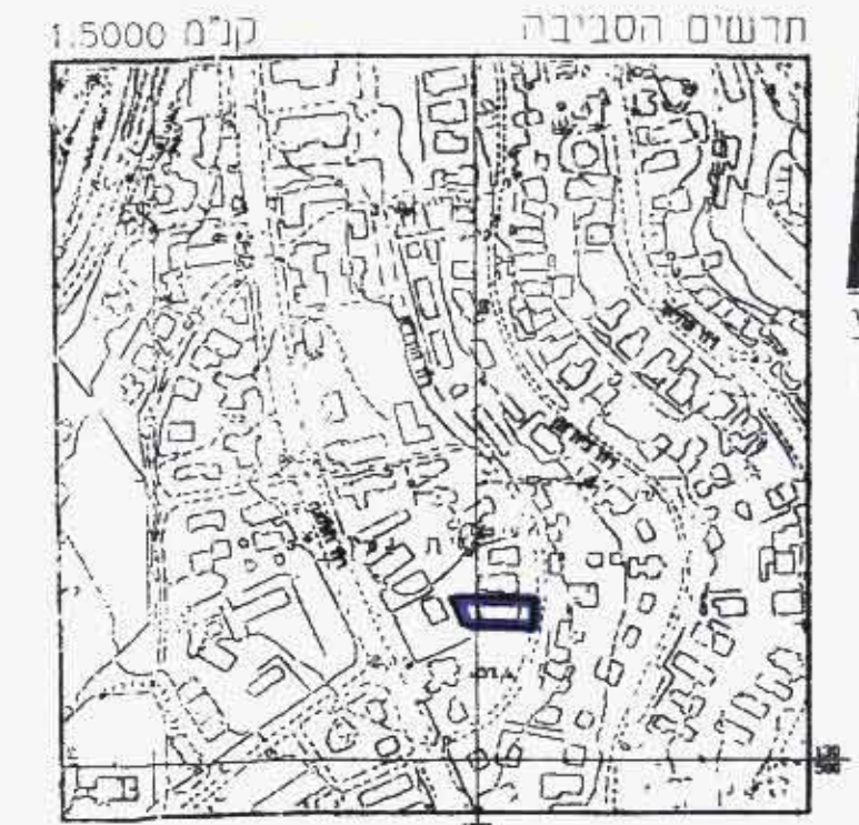
קרנף 1:5000 הרשים הסביבה