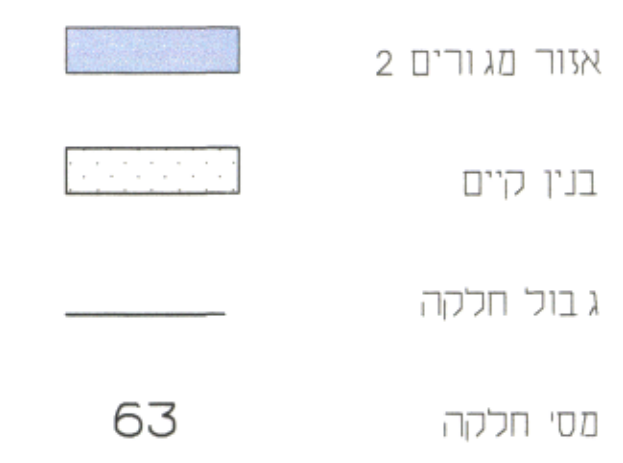
מקרא מצב מאושר :

מחוז : ירושלים נפה : ירושלים עיר : ירושלים, שכונה רחביה מקום : רח' אלפסי 28 גוש : 30025 חלקה : 63 שטח : 0.612 ד' קנה מידה : 1 : 250