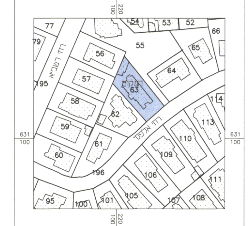
מצב מאושר עפ"י תכנית המתאר המקומית לירושלים קנה מדה : 1 : 1250