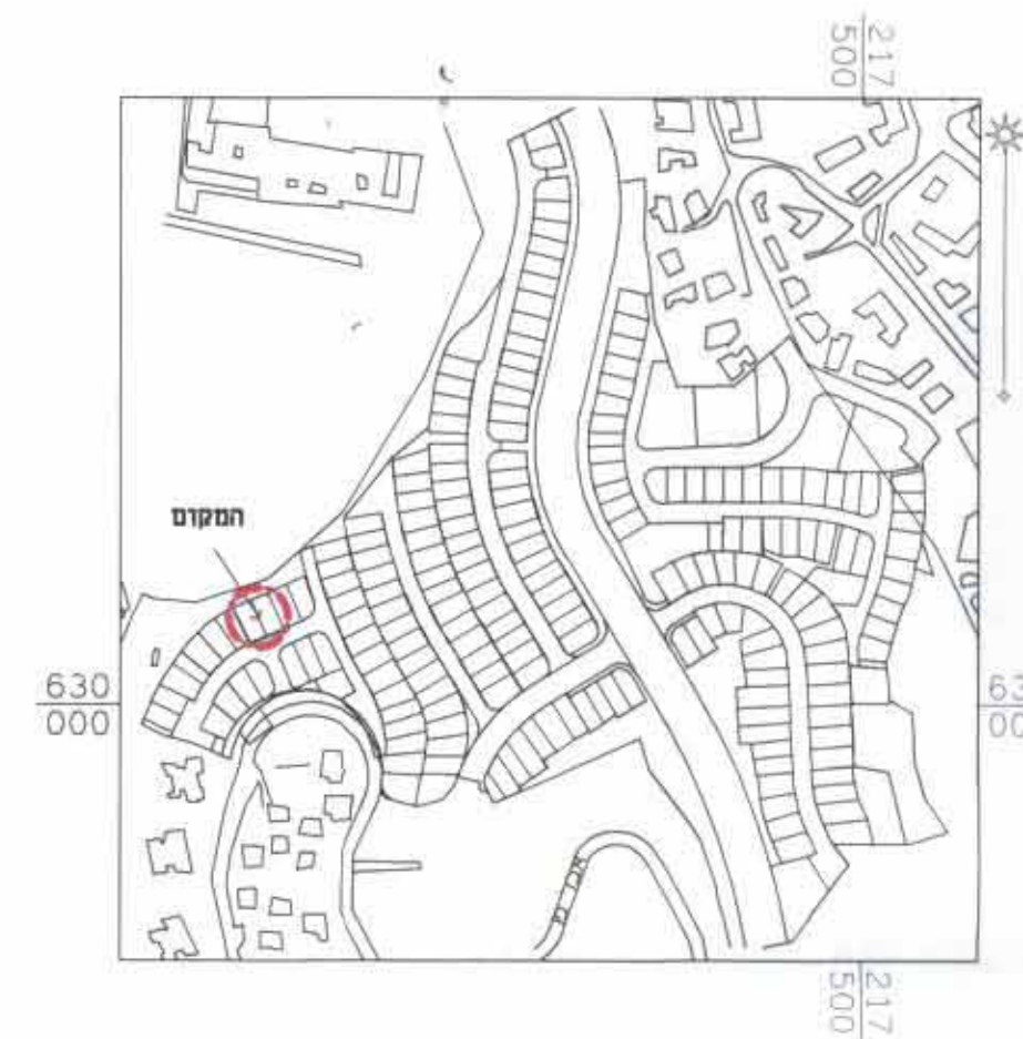
תרשים הסביבה קנ"מ 1:5000