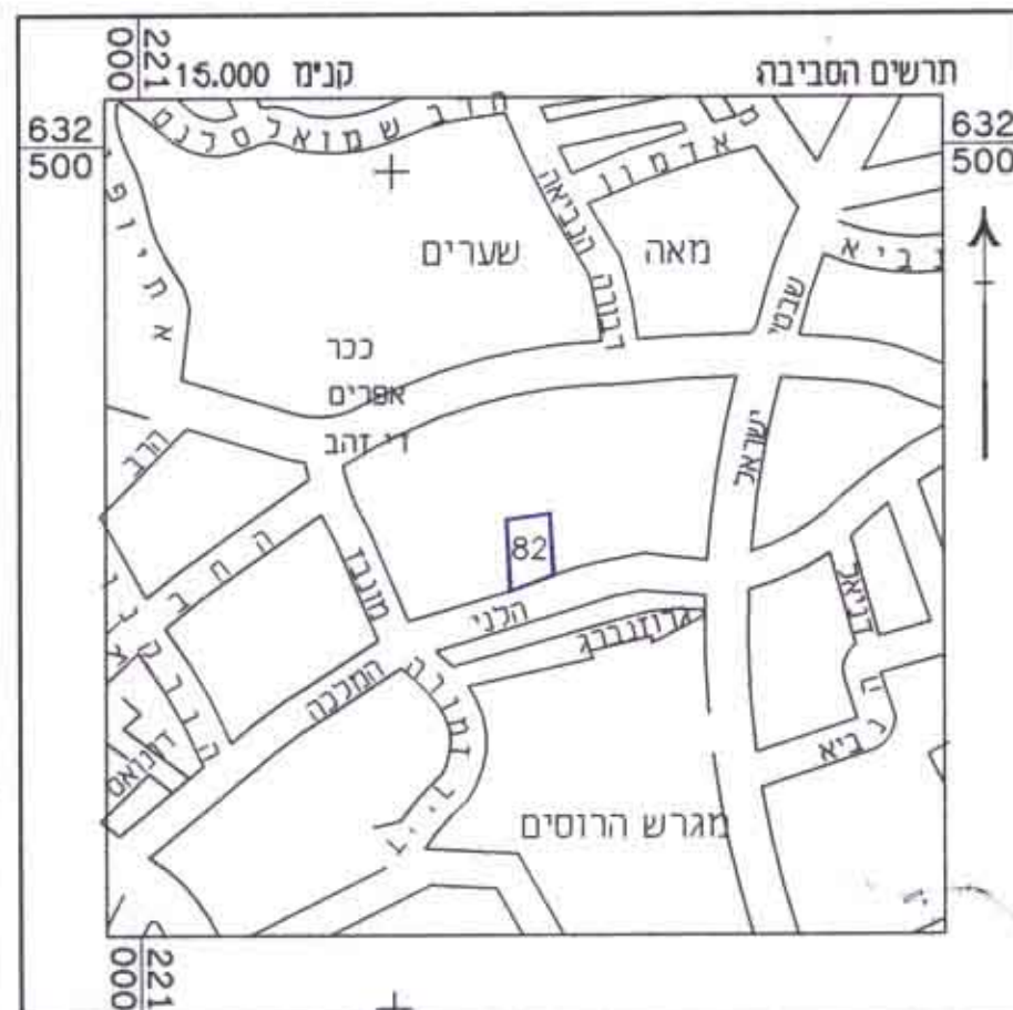
תרשים הסביבה - קנה מידה 1:5000