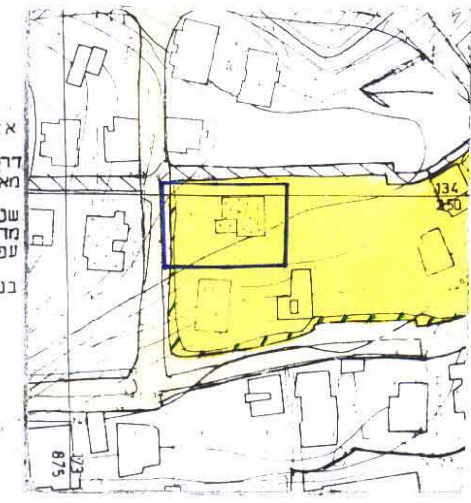
מצב מאושר ע"פ תכנית מס' 2316 ק.מ. 1:250

משרד הנגים מחוז ירושלים אישור תכנית מס' 6879 הועדה המחוזית החליטה לאשר את התכנית בשינוי מס' 1103 ביום 4/1/03 סגנית הנגן