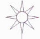
תרשים הטביבה קנ"מ 1 : 5000