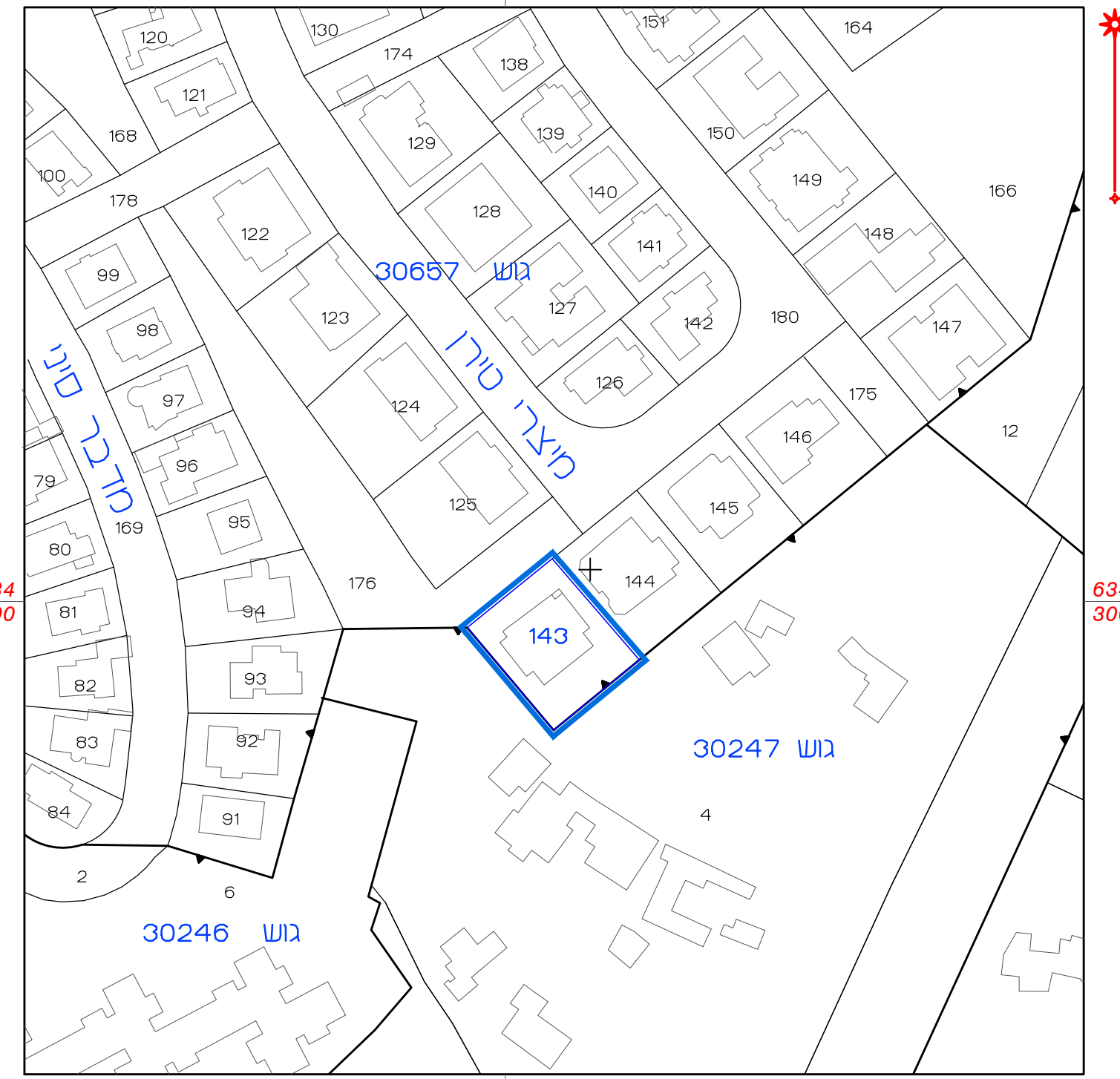
תרשים סביבה קרובה קנ"מ 1:250