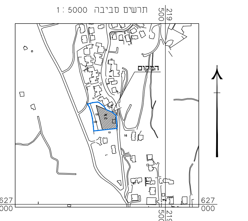
תרשים סביבה קרובה קני"מ 1:5000

חוק התכנון והבנייה, התשכ"ה - 1965 תכנית מפורטת