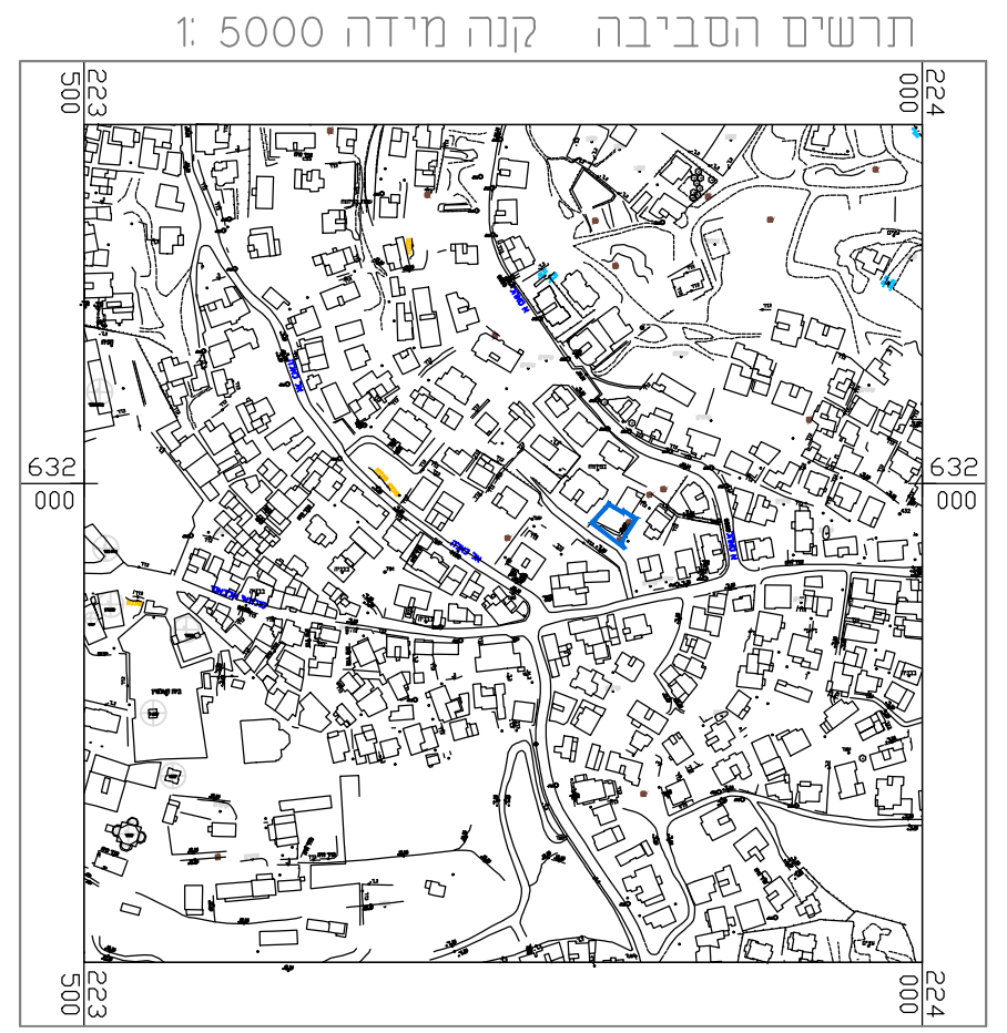
תרשים סביבה קרובה קנ"מ 1:5000

מספר התוכנית: 30897-1 רמת דיוק המכול והמדסטר: 3 1 = מדידה גרפית 2 = קו נחול (כלבד) ברמה אנליטית 3 = מדידה אנליטית מלאה ברמת תציר 1. המדידה המקורית הריני מצויר בואת כי מדידת המפה הטופוגרפית/ המוציאת המראה רקע לתוכנית זו. נערכה על ידי: ביום 15-1-2018 ורואי הוכנה לפי הוראות נוהג מביאית ובהתאם להוראות החוק וכתקנות המודדים שבתוסף. שם המודד: גבארה תאופיק מספר רישומו: 991 החתימה: _____ תאריך: _____