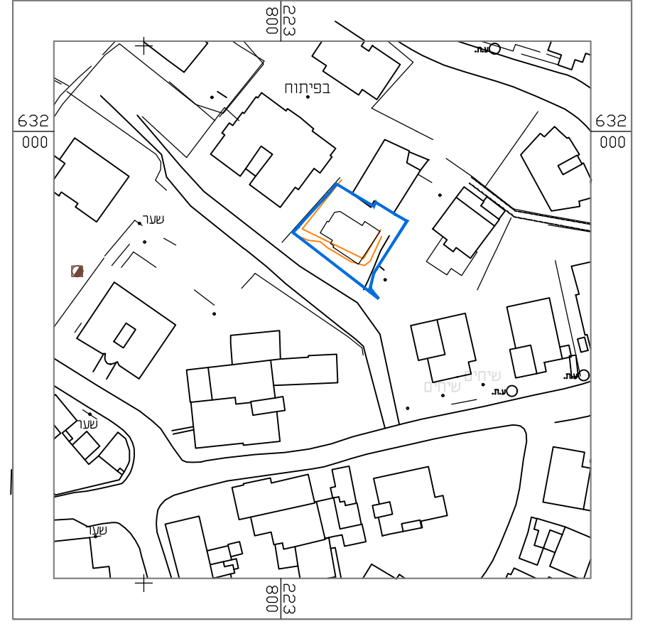
תרשים סביבה כללית קנ"מ 1:1250