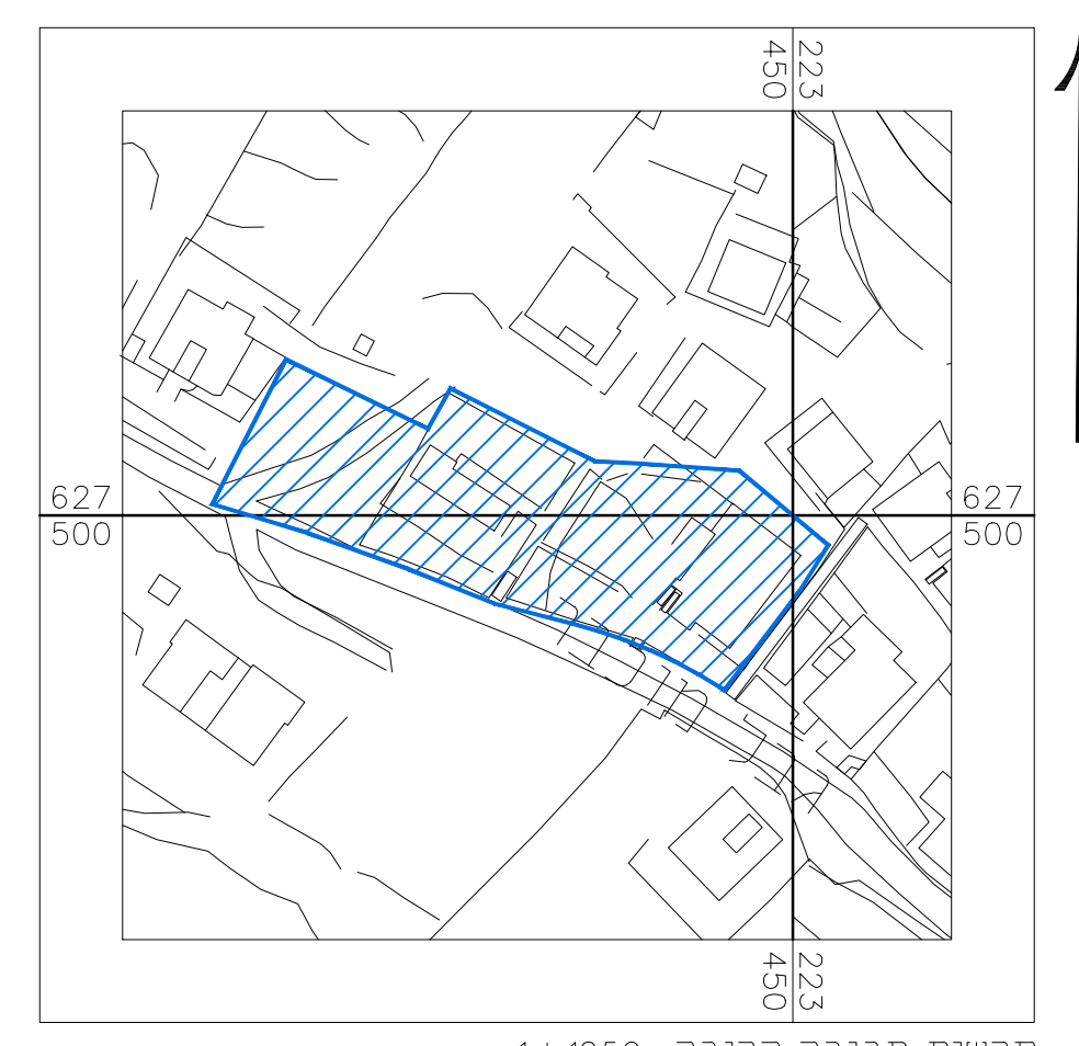
תרשים סביבה קרובה 1:1250