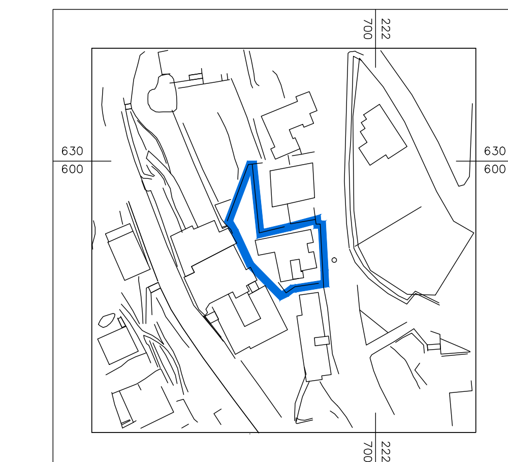
תרשים סביבה כללית קנ"מ 1:1250