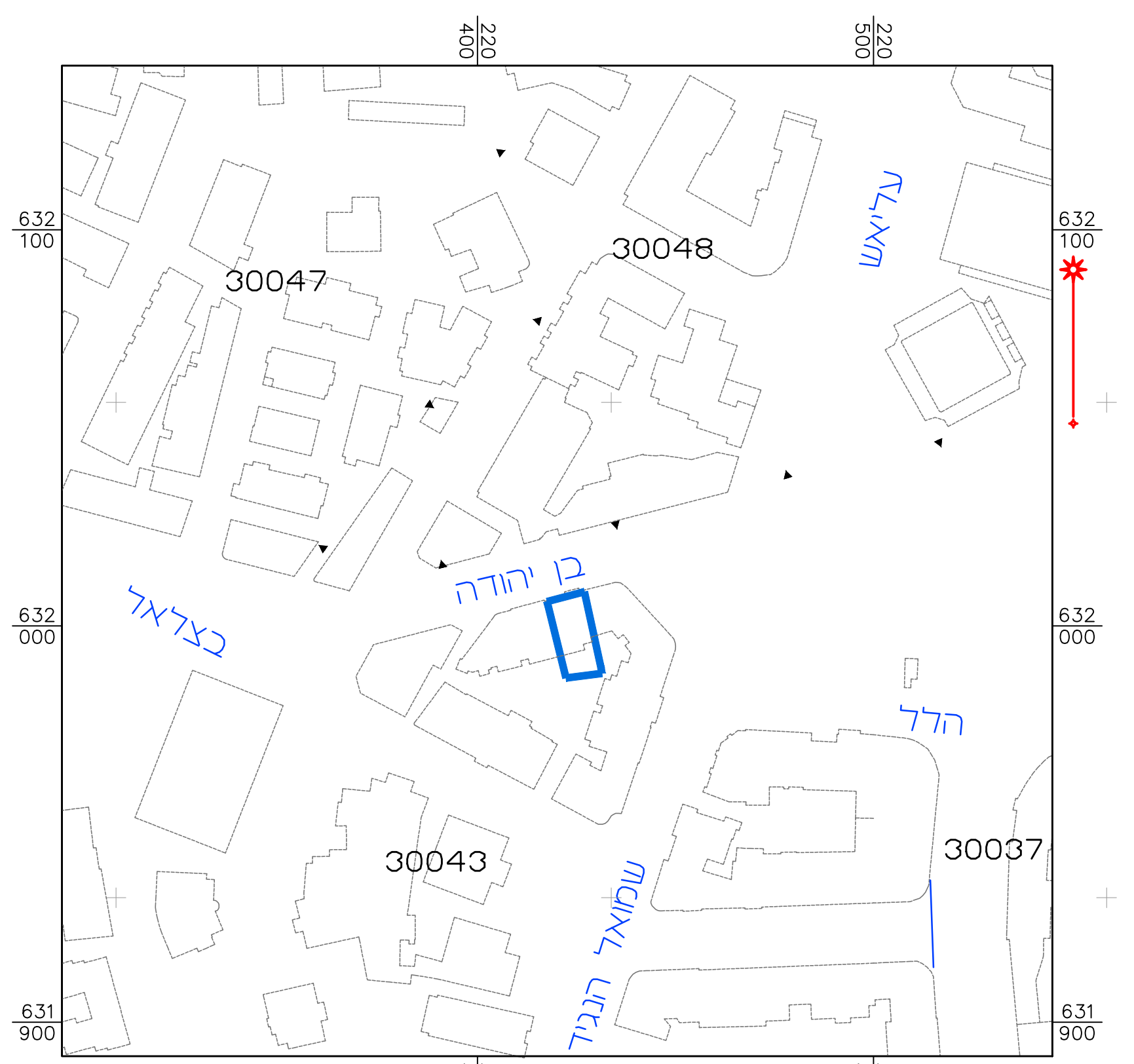
תרשים סביבה קרובה קנ"מ 1:250

הערות: 1. המדידה קשורה לרשת קואורדינטות ארצית ע"י נקודות 8371RC, 224RM GPS. 2. המדידה קשורה לרשת גבהים ארצית. 803.00=8371RC BM. 3. גבולות ושטח החלקה נלקחו מתציר מס' איציפה 630/75. קנה מידה 1 : 250