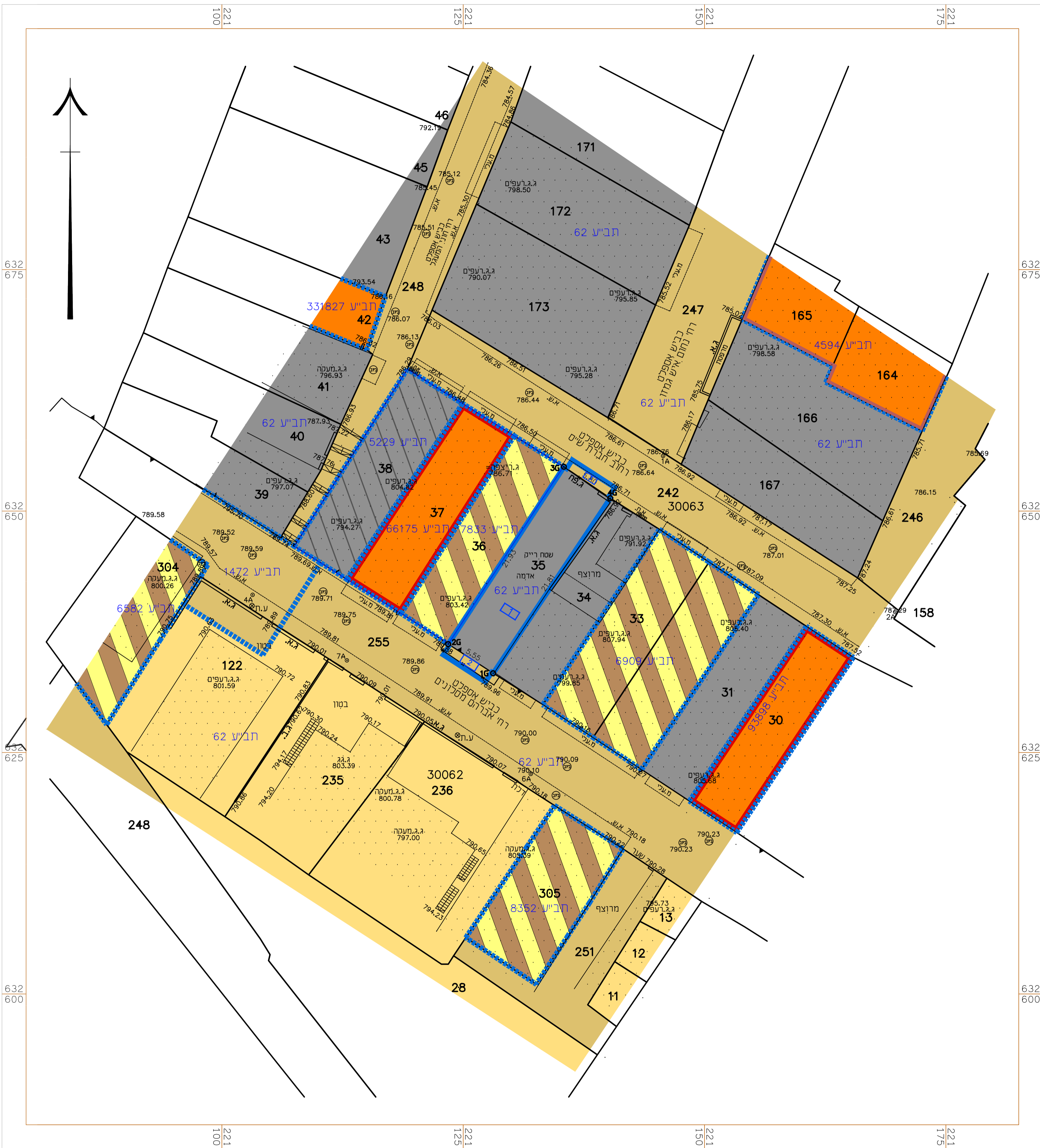
תרשים סביבה קרובה 1 : 1250