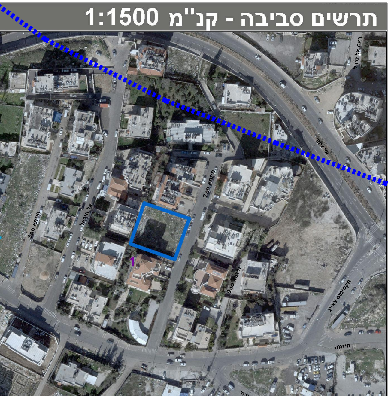
תרשים סביבה - קנ"מ 1:1500

מספר התוכנית: JR59-2 רמת דיוק המדידה והמדסטור: 3 1 = מדידה גרפית 2 = קו כחול כבלנד, ברמה אנליטית 3 = מדידה אנליטית מראה ברמת תציר 1. המדידה המקורית הריני מצהיר בזאת כי מדידת המפה הטופוגרפית/ המצבית המהווה רקע לתוכנית זו, נערכה על ידי: ביום 28-06-2018 וריא הוכנה לפי הוראות נוהל מדידה ובהתאם להוראות החוק ולתקנות המודדים שבתוקף. שם המודד: עומר האני מספר רישיון: 1180 חתימה: _____ תאריך: _____