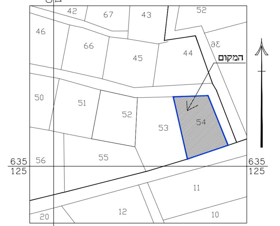
תרשים סביבה כללית קנ"מ 1:1250