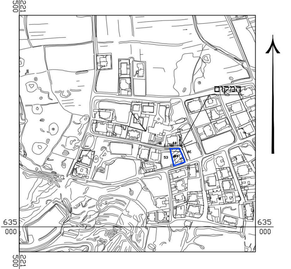
תרשים סביבה קרובה קנ"מ 1:5000