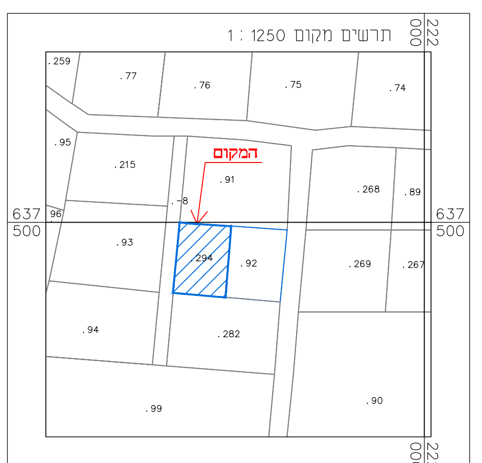
תרשים סביבה קרובה 1:1250