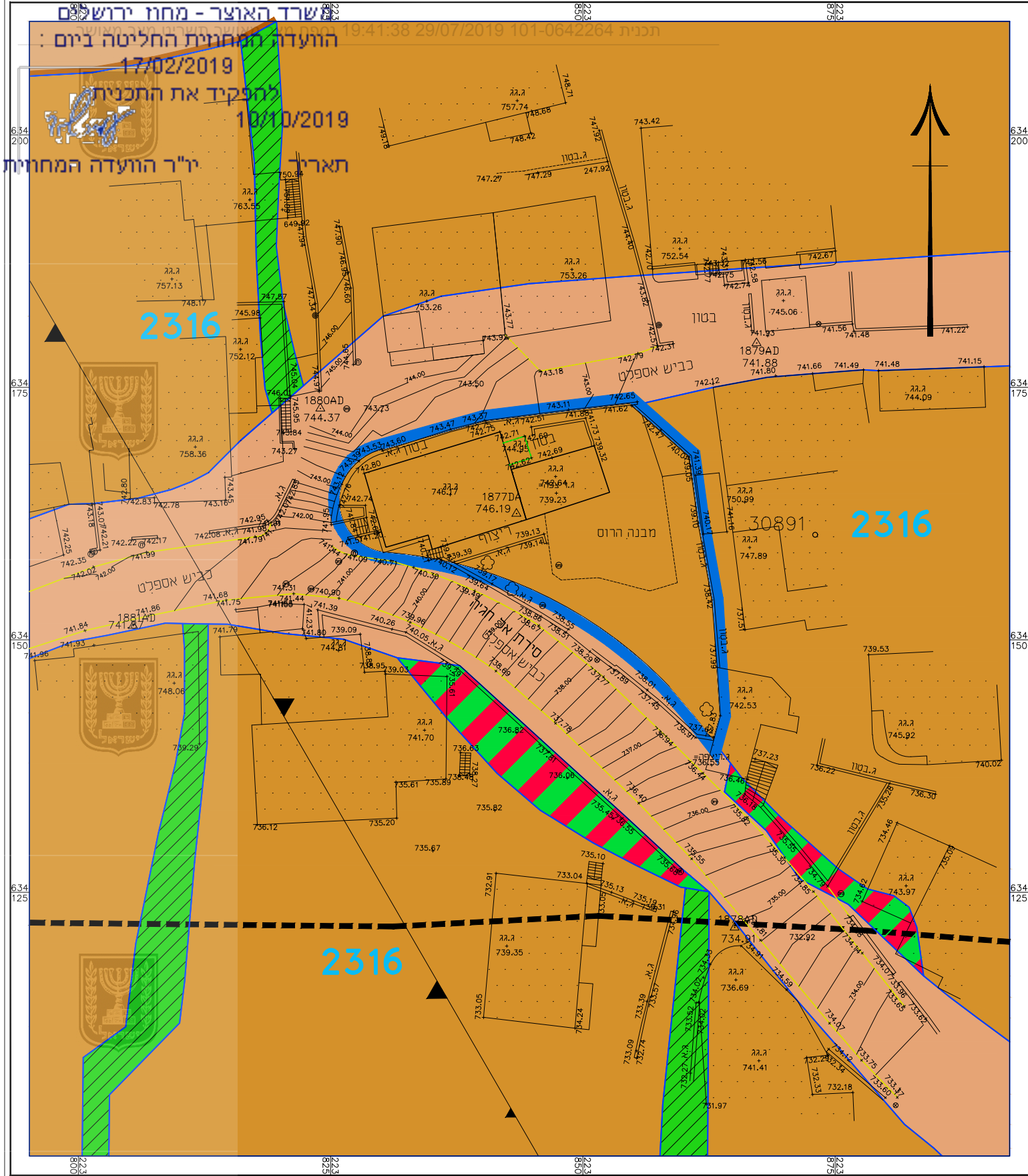
מצב מאושר ע"פי תכנית 2316 קנ"מ 1:500