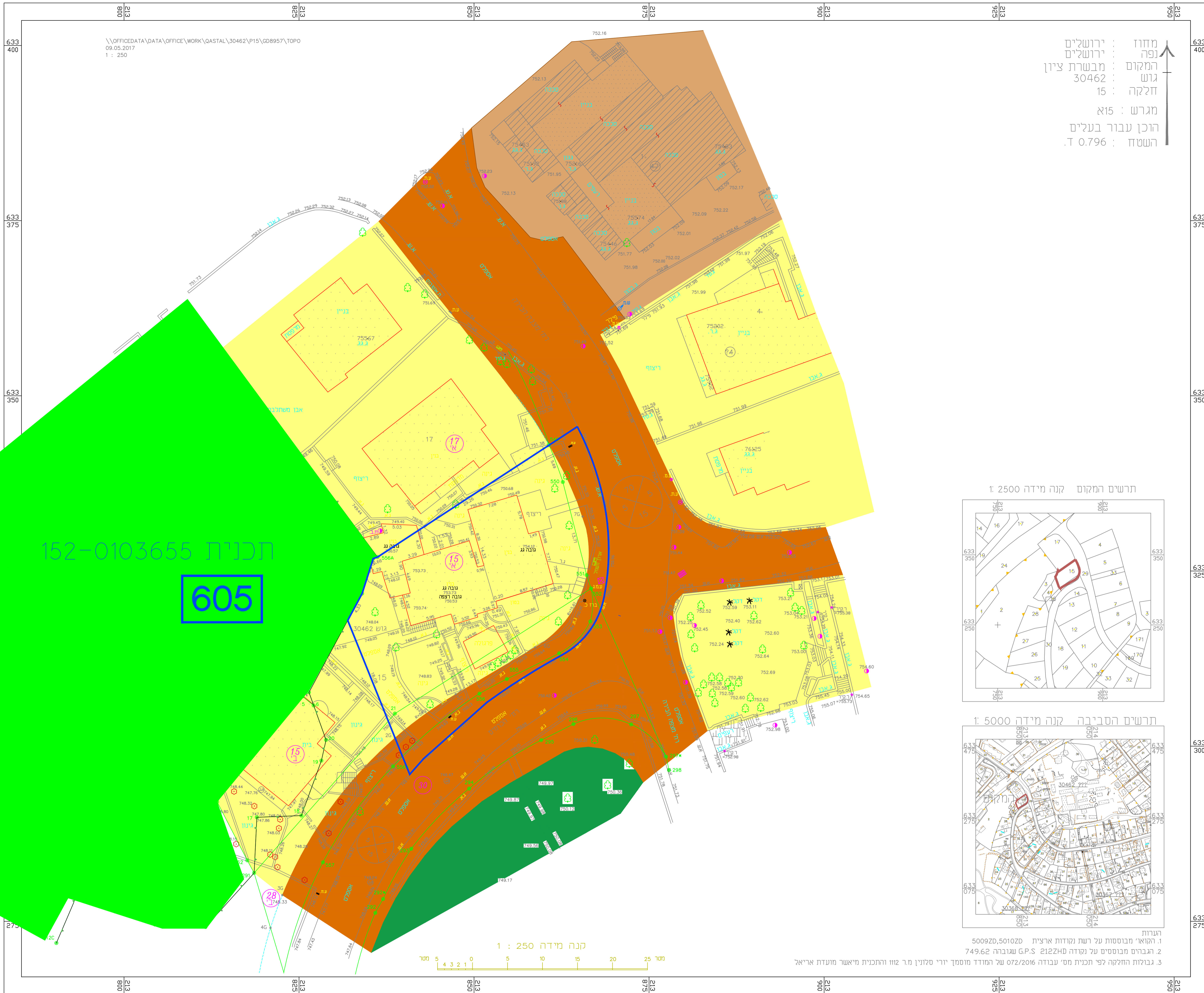
תרשים המקום קנה מידה 1:2500