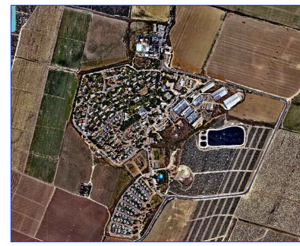
תצלום אוויר קיבוץ נגבה - כנסות לקיבוץ