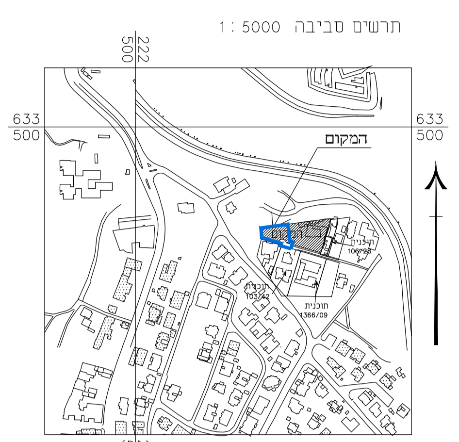
תרשים התמצאות כללית 1: 5000