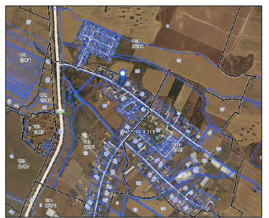
מיקום על רקע כוכב מיכאל 1:10000

חוק התכנון והבניה התשכ"ה - 1965 תכנית מפורטת