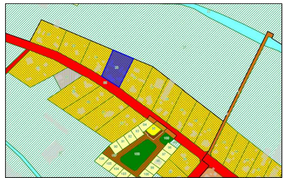
תרשים סביבה על רקע 2/166/03/6 1:2500