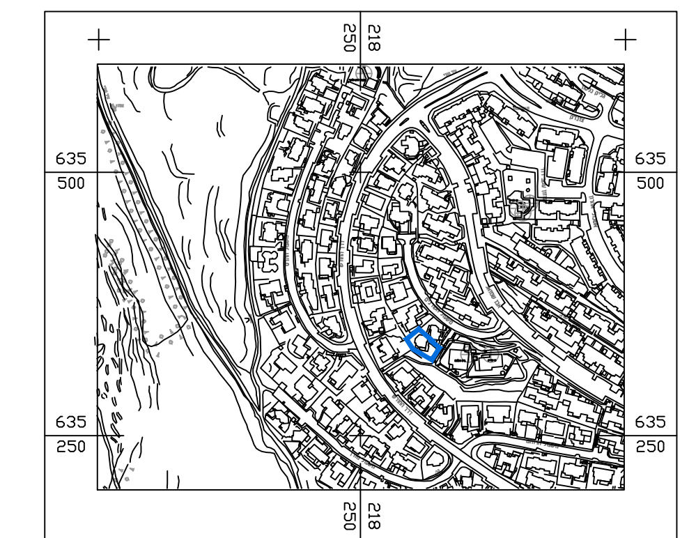
תרשים התמצאות כללית קנ"מ 1:5000

הריני מצהיר בזאת כי מדידת המפה והספגרפית/מצבית המורחגת להצגת זו, נערכה על ידי ביום: ורא הוכנה לפי תוראות נוהל מבית ובתאם לדריאות החוק ולמטרת המודדים שבתוקף. דיוק המדידה והקדסטרו: מדידה גרפית/קו כחול (בלבד) ברמה אנליטית/אנליטית מלאה ברמת חצר (כולל המדידה/אנליטית מלאה ברמת חצר). אבו רגיב נואר שם המודד: 168 מספר רישון: חותימה: תאריך: