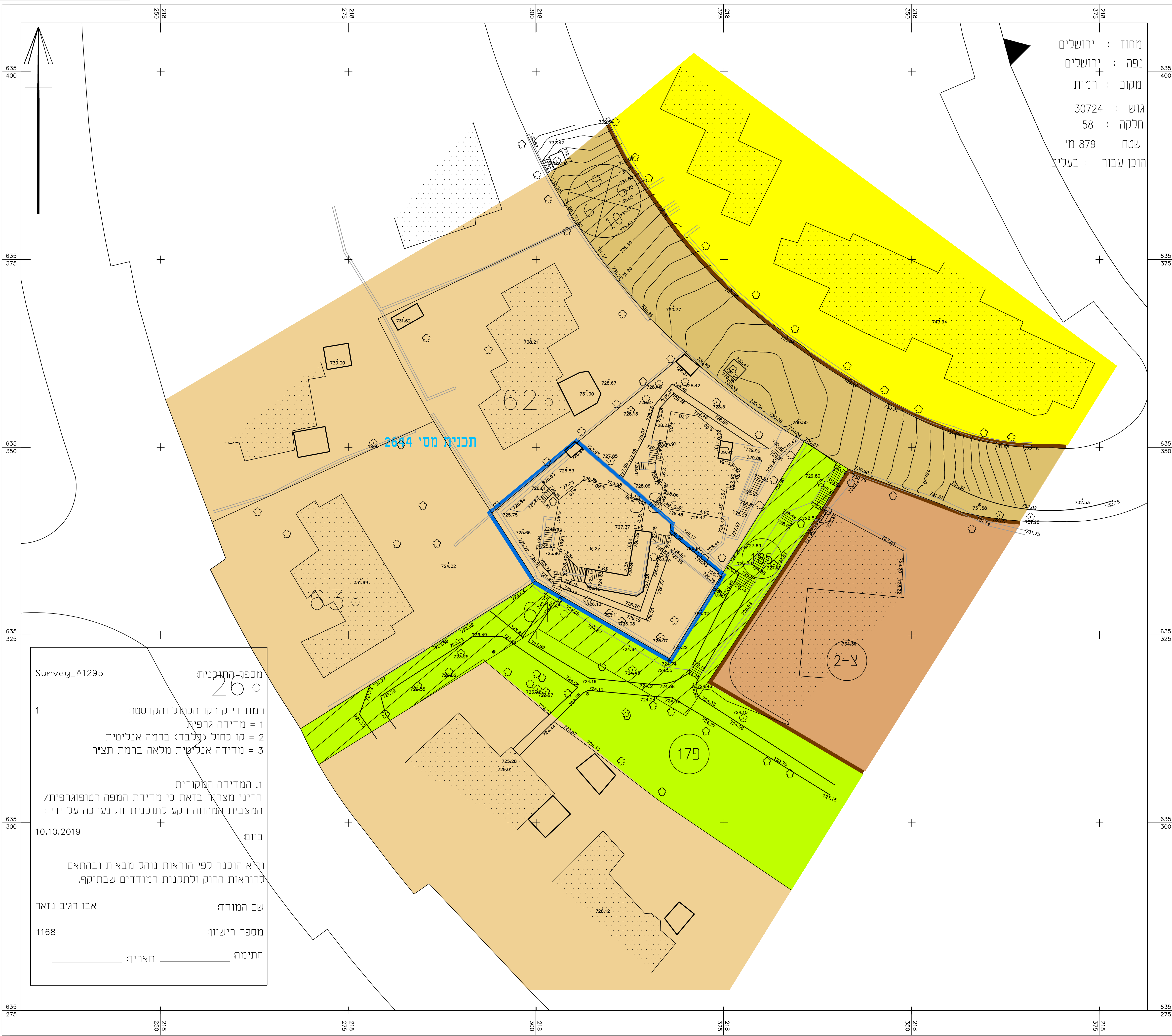
מצב מאושר קנ"מ 1:250

מחוז : ירושלים נפה : ירושלים מקום : רמות גוש : 30724 חלקה : 58 שטח : 879 מ' הוכן עבור : בעלים