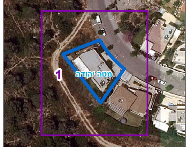
שנת צילום אוויר: 2019