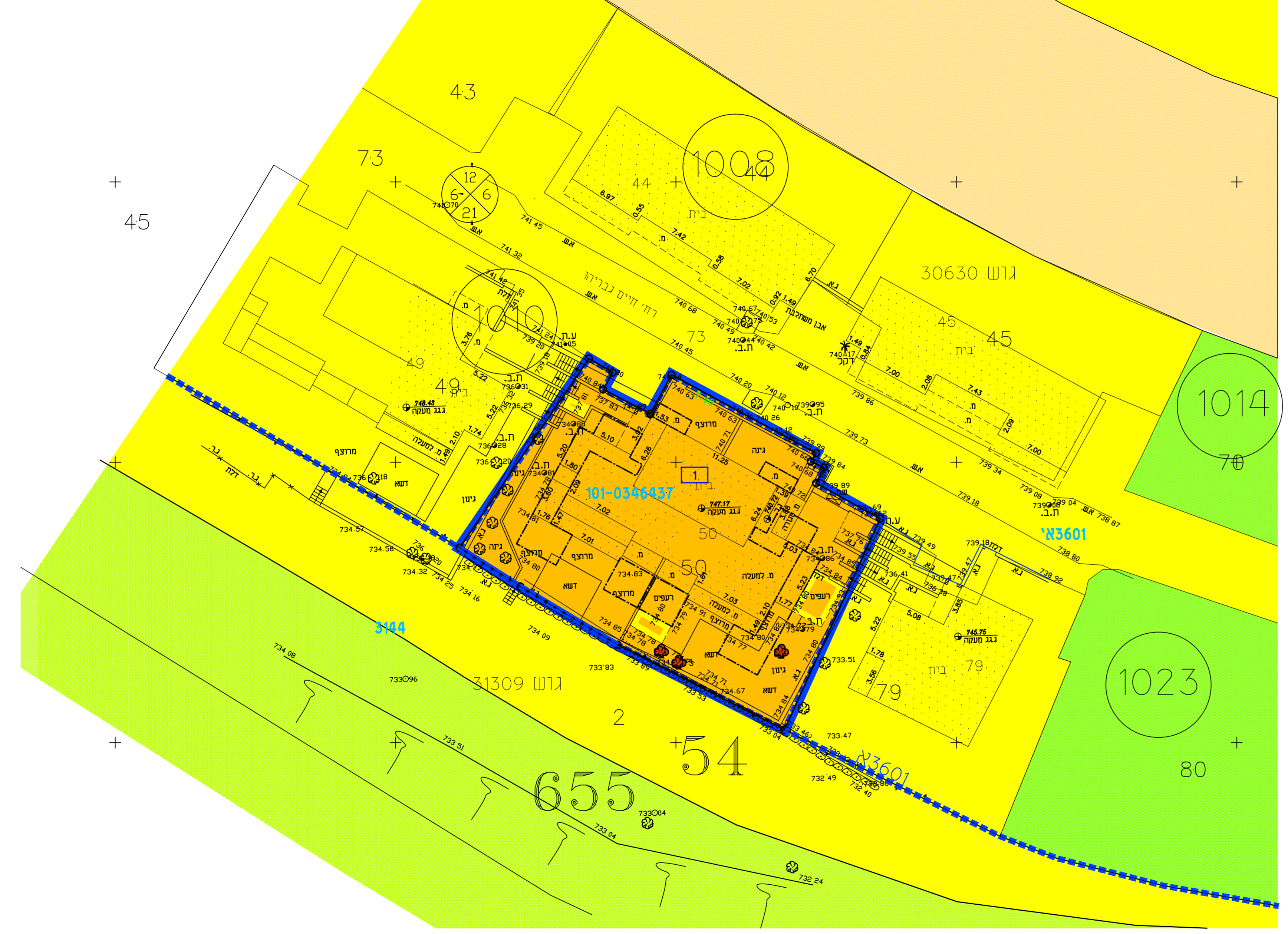
קנה מידה 1 : 250