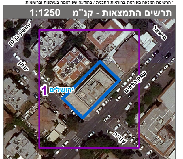
שנת צילום אוויר: 2019