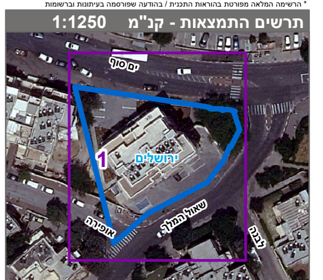
שנת צילום אוויר: 2019