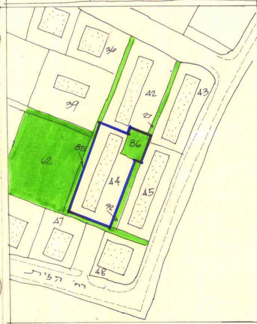
תרשים עביבה 1:250

חתימת הועדה המחוזית חוק התכנון והבניה תשכ"ה-1965 ועדה מקומית לתכנון ובניה "יבנה" תכנית מפורטת מס' יב/215 משיבה מס' 9/89 מיום 14.9.89 הוחקק מס' 28/10/89 חתימת הועדה המחוזית