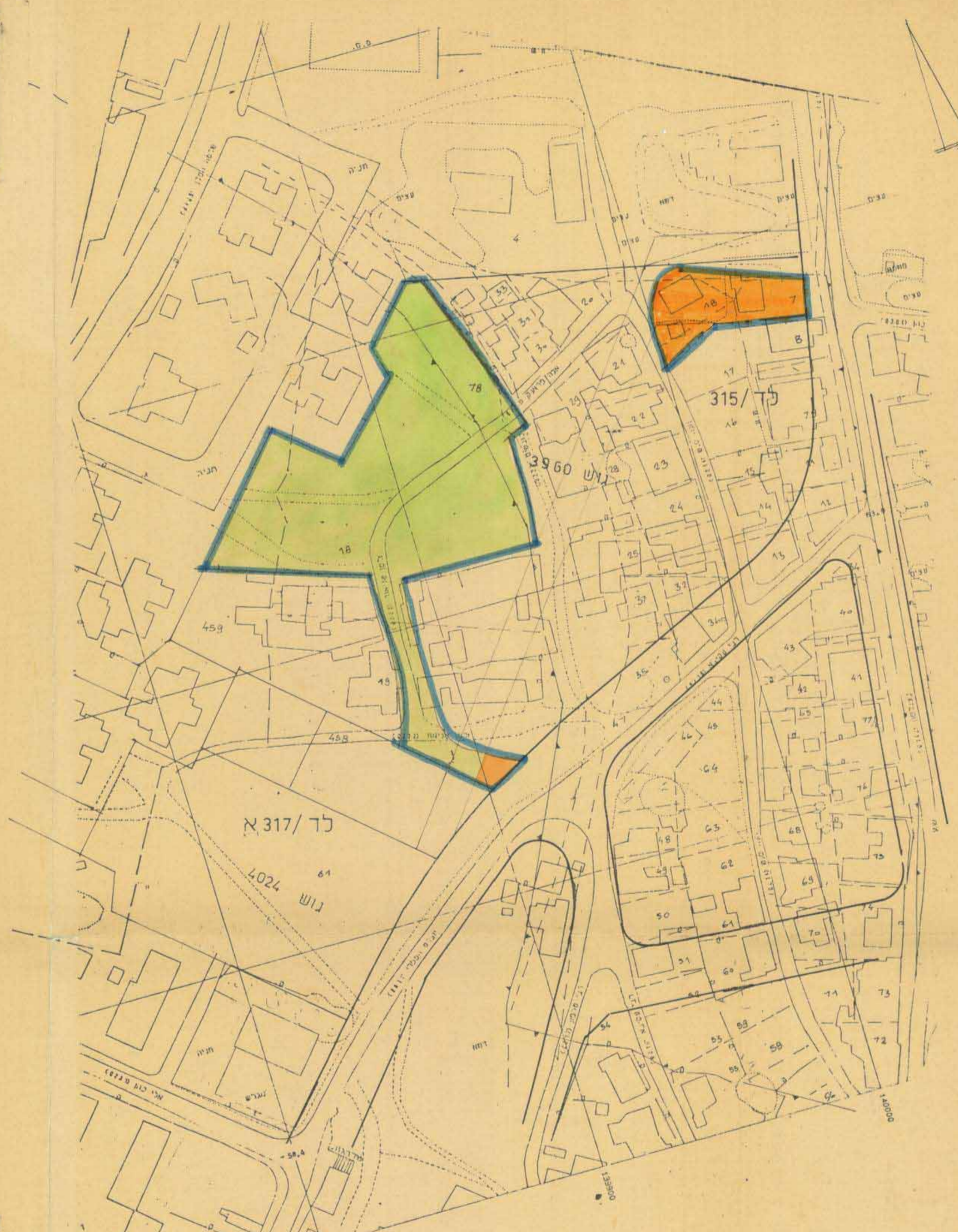
מצב ק"מ 1:1250