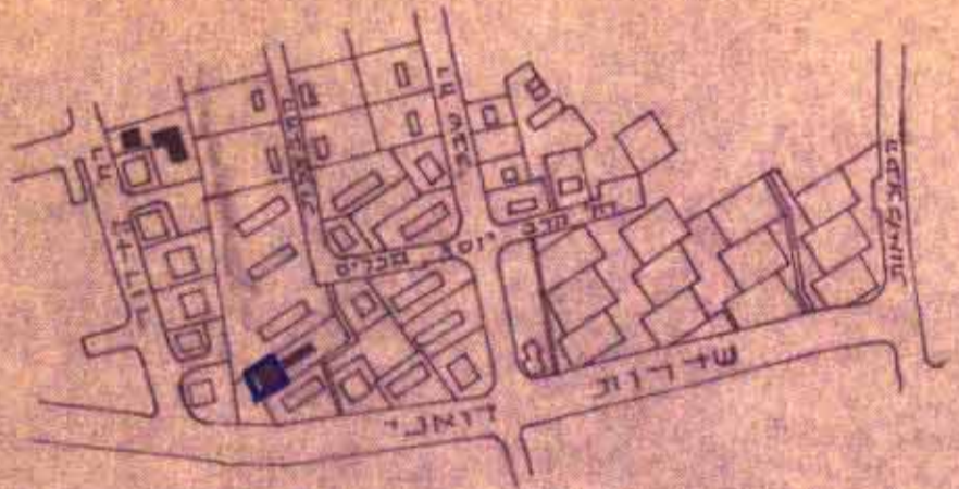
תנאים טכניים קנה 1:5000