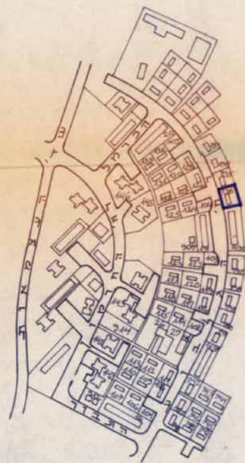
גרשים טבעי קלמ 1:5000