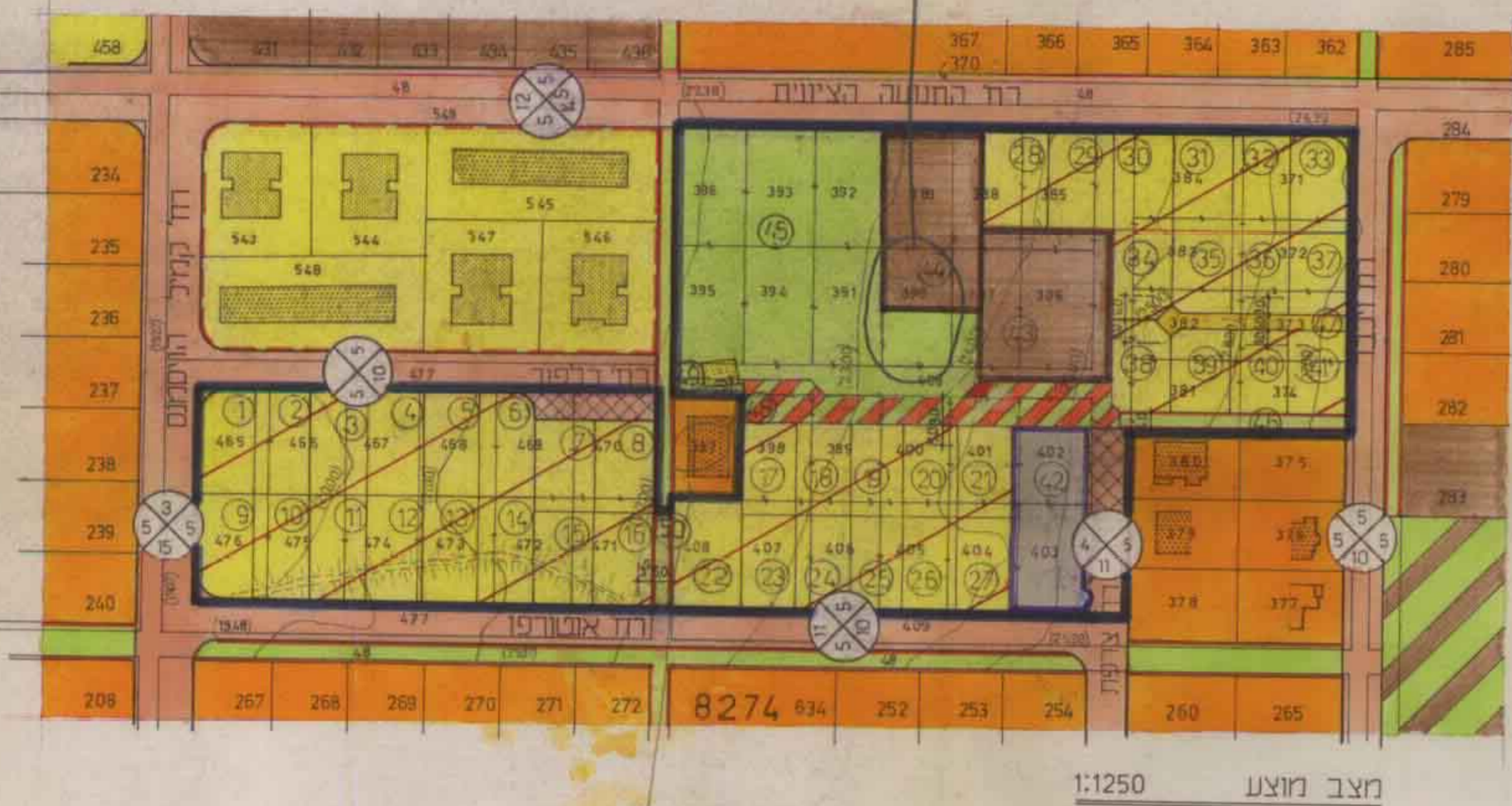
מצב מוצע 1:1250

אישור תכנית מס' נת 28/307 תאריך: 20.12.2007 חתום: [Signature] משרד התכנון והבניה