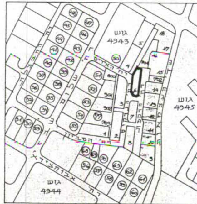
תדשים סביבה קלמ' 1:5000