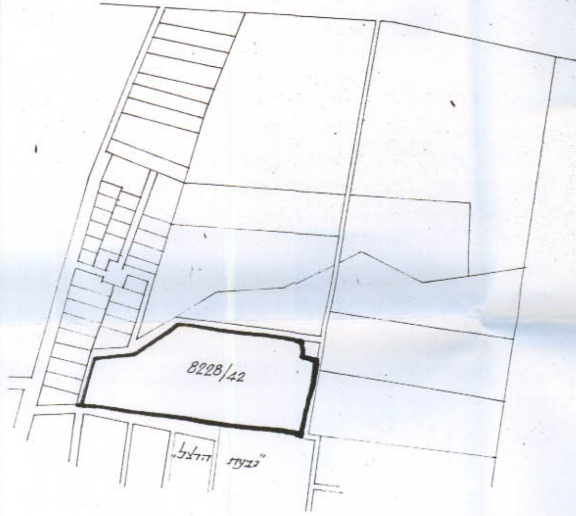
תרשים הקביבה - 1:5000

התכנית הסדרה עוסקת בהתחלת האזור מוכרם ביניהם ה- 7/2/50 תוקף 19/42/51