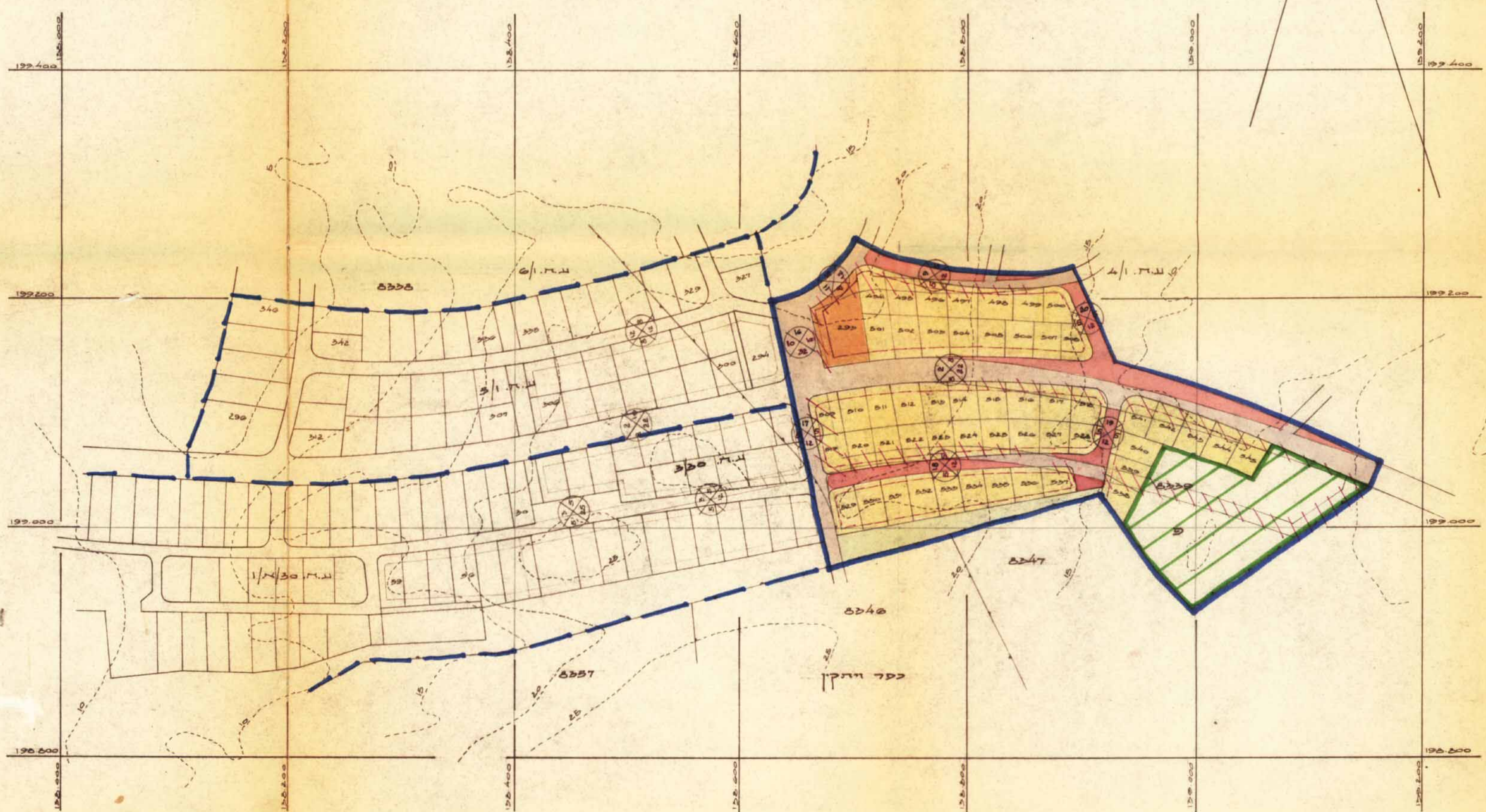
תכנית מתוכננת מס. ע.ה.ו/8, 1:2500