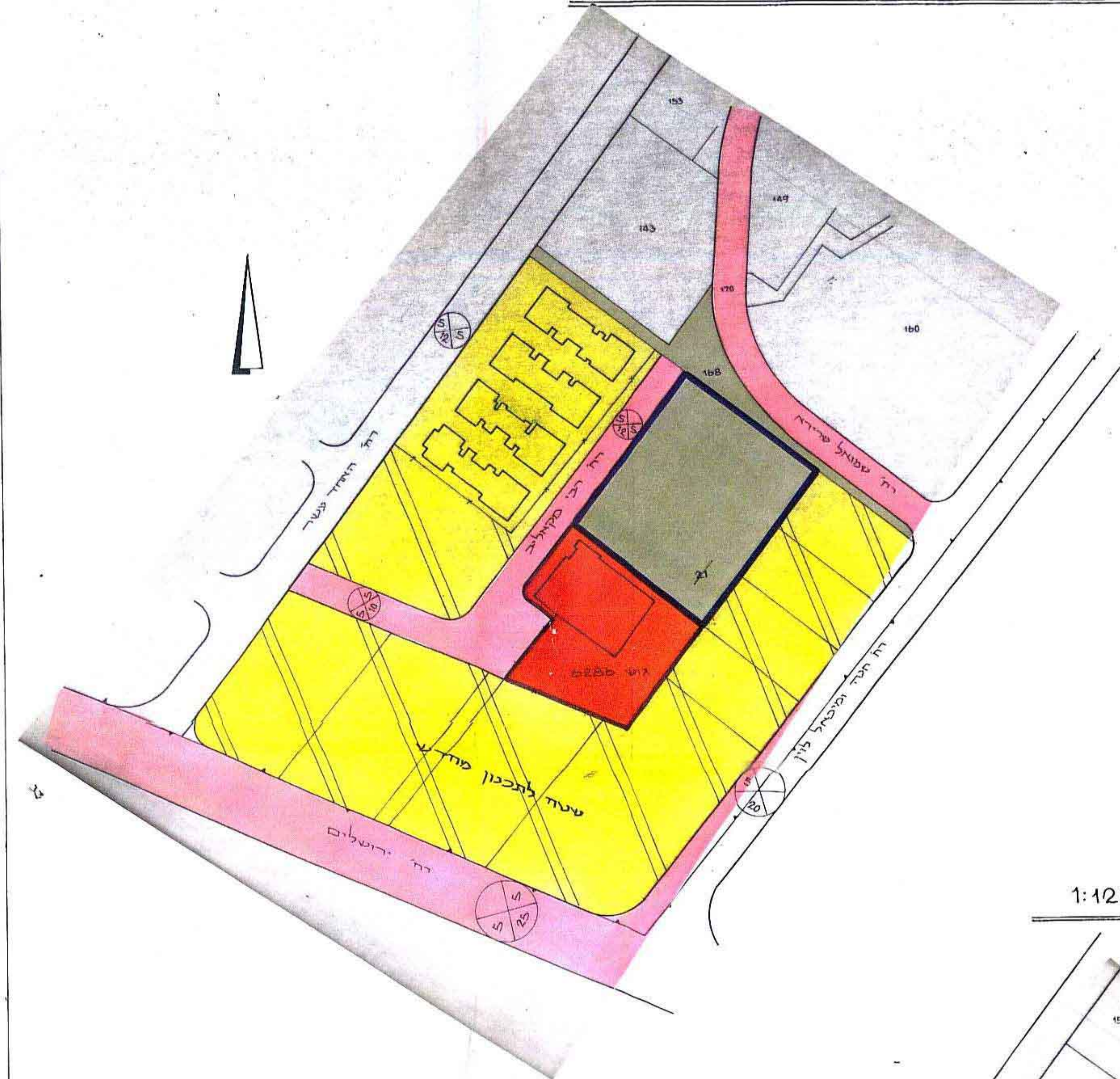
מצב קיים — קנ"מ 1:1250