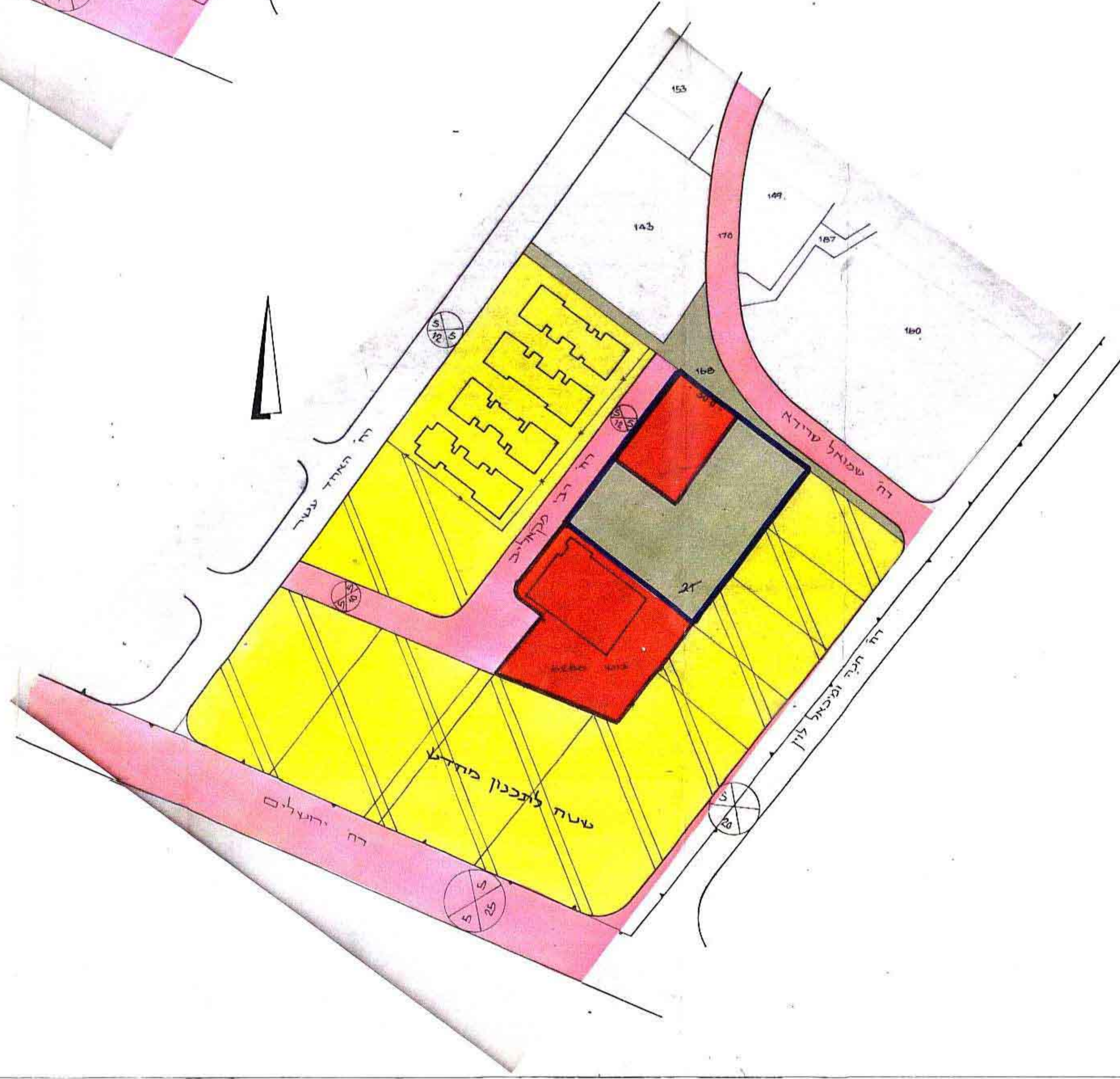
מצב מוצע — קנ"מ 1:1250