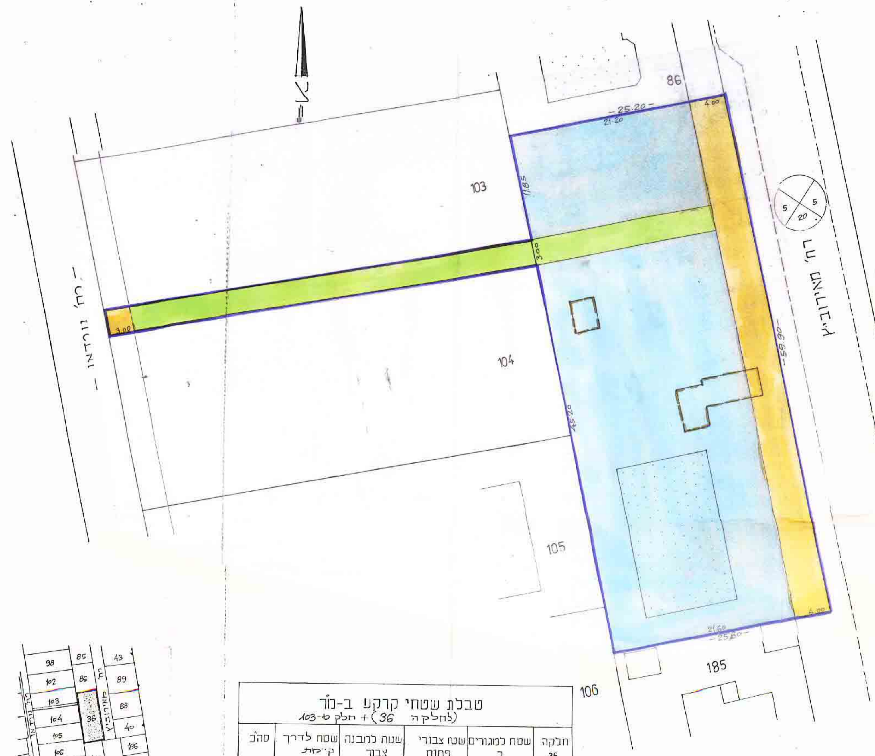
מצב קיים 1 : 250

חתימת היוזם חתימת בעלי הקרקע חתימת המתכנן