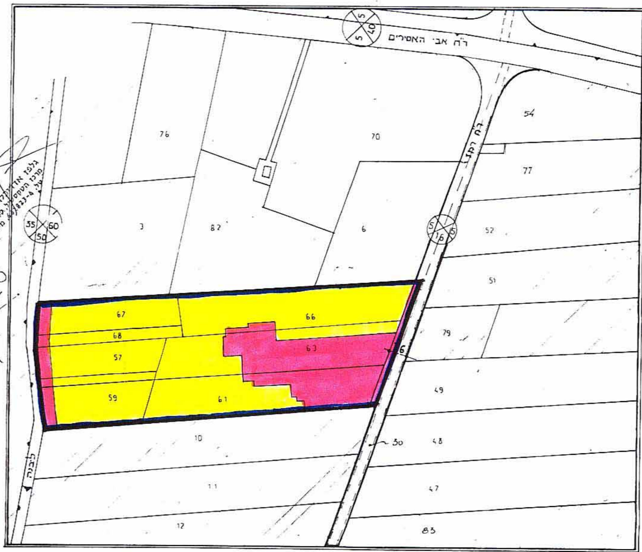
מצב מוצע ק.נ. 1:2500

בדיקת תכנית כפורטת מ"ד 1/1/87 יו"ר: א. גולן מ"מ: א. גולן מ"מ: א. גולן