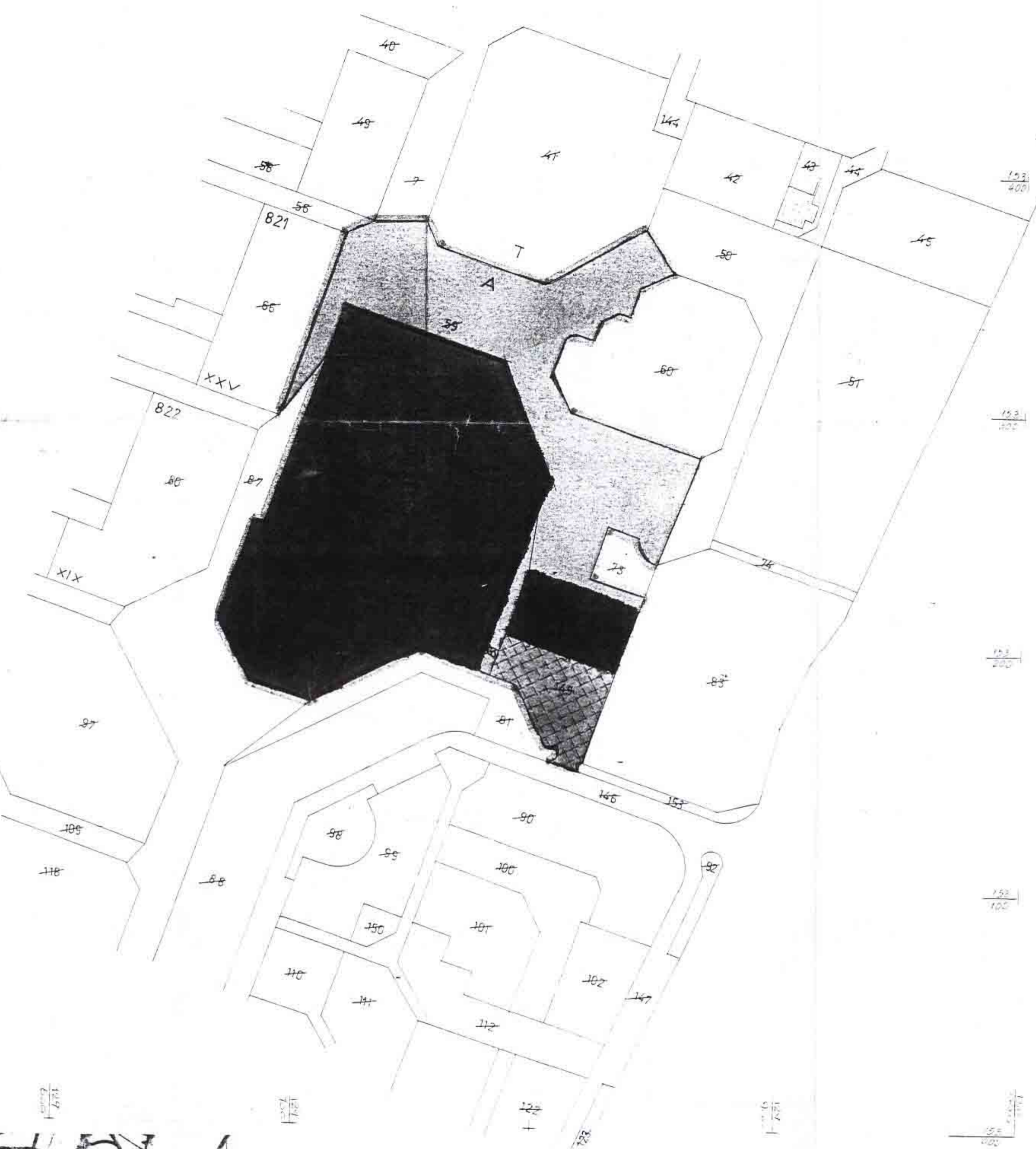
מצב קיים 1:1250