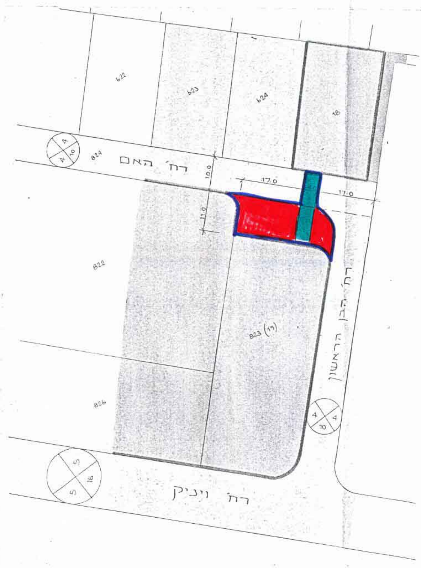
מטב מוצע — קנ"מ 1:625