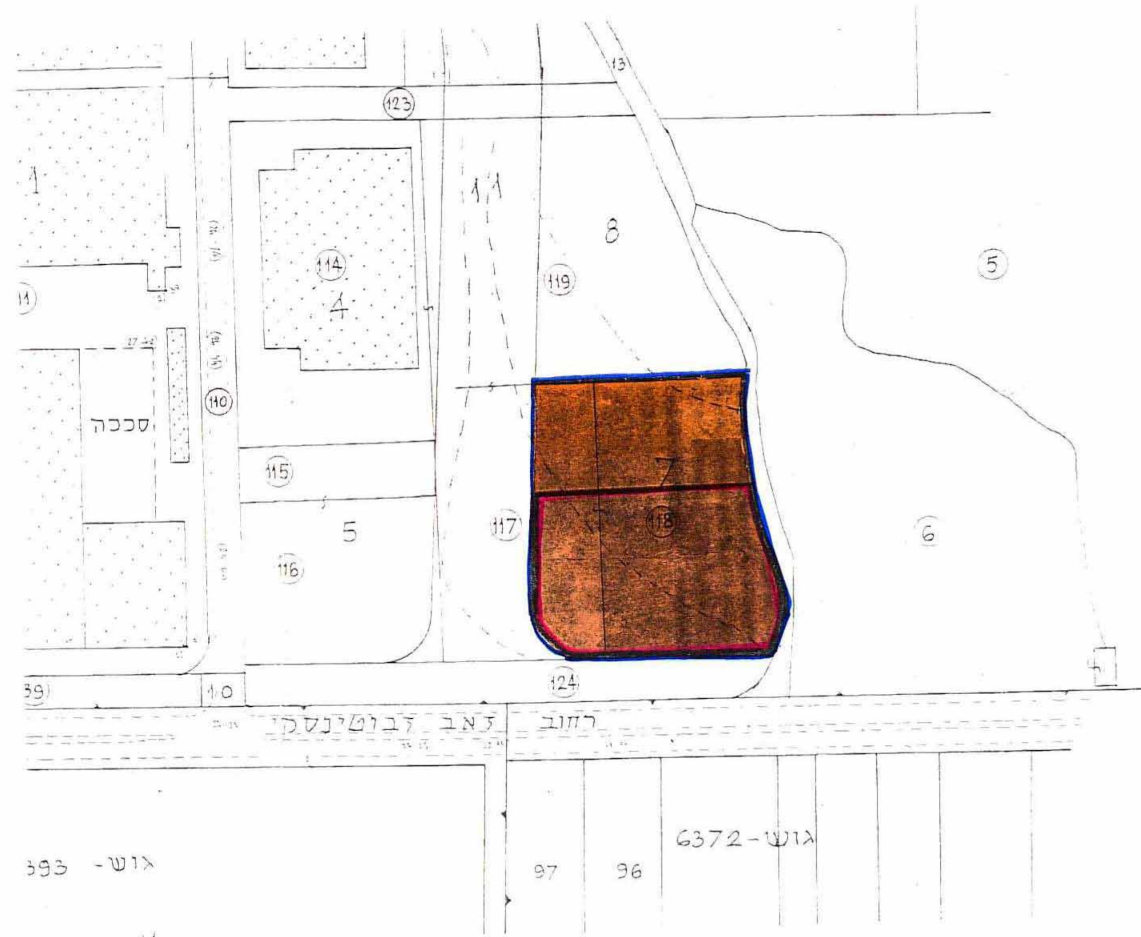
מצב מוצע - קב"מ 1:1250