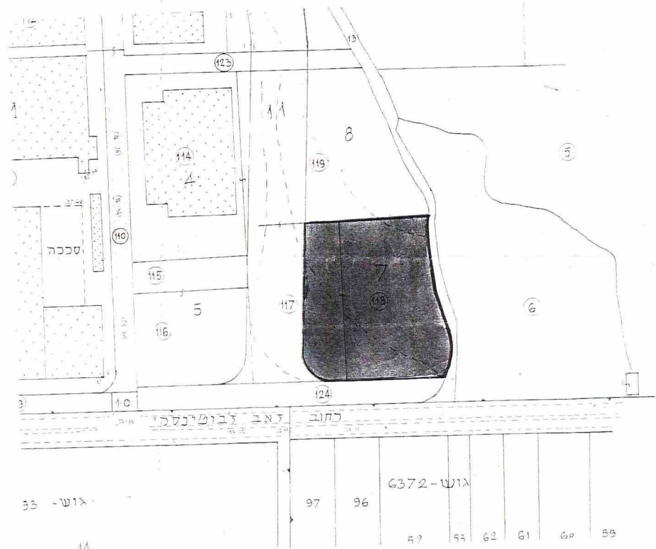
מצב קיים - קב"מ 1:1250