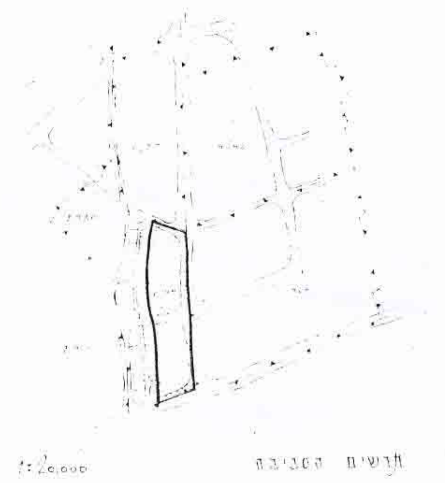
הצגת מיקום התכנית