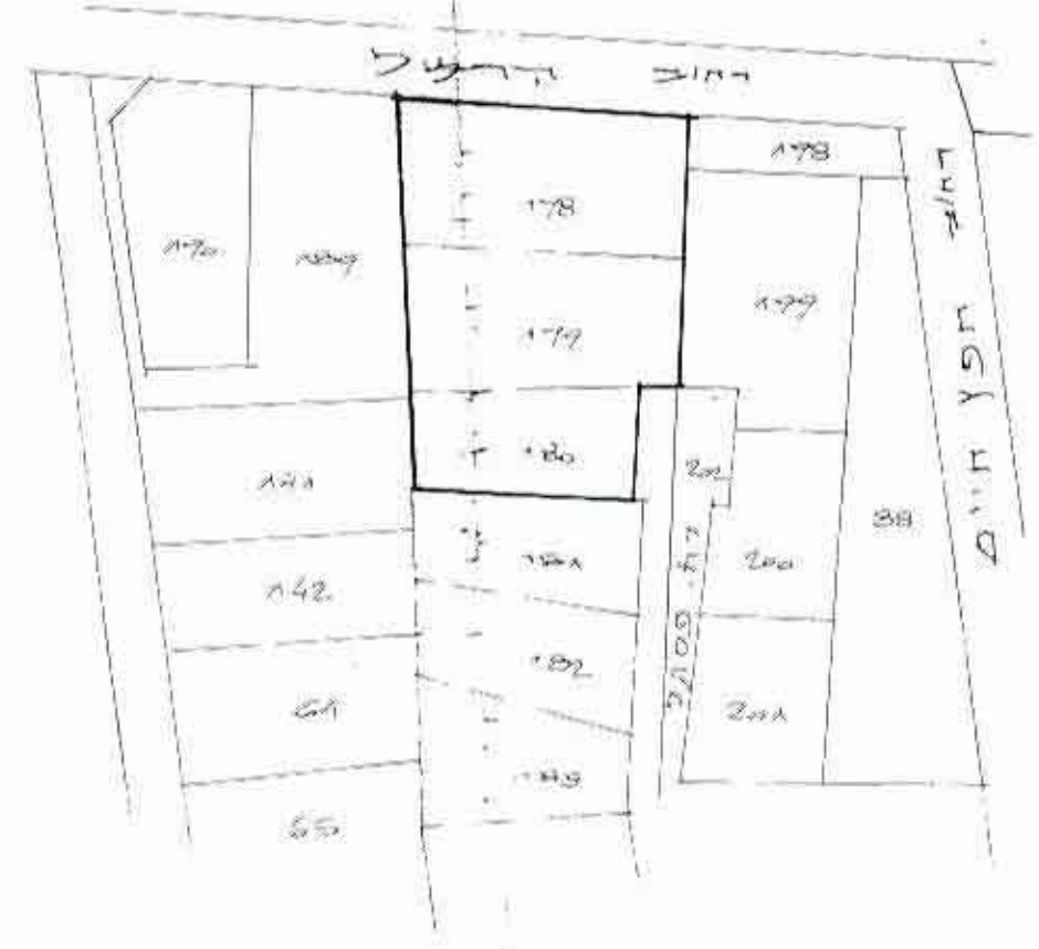
תרשים סביבה 1:1250